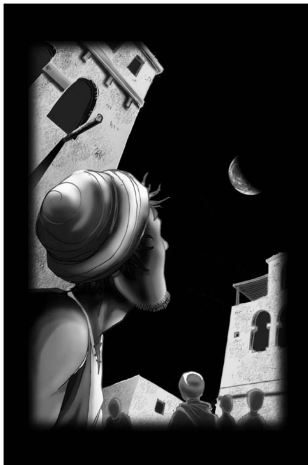
illustration : Nicolas Léger / Franck Goubet Création

Le Forum départemental des Sciences vous propose également des outils itinérants sur le thème de l'astronomie : malle doc - astronomie, la valise Cosmos, le planétarium itinérant et les expositions - Cosmos, une histoire des représentations de l'Univers - L'espace à quoi ça sert? - Les ateliers à la découverte du ciel.