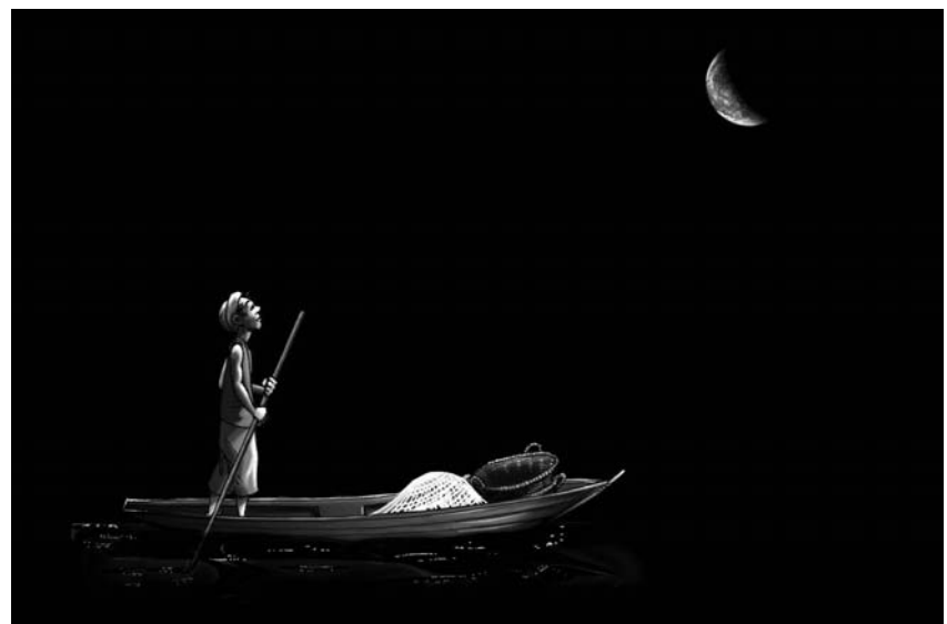
illustration : Nicolas Léger / Franck Goubet Création

nuit, les poissons pris dans son filet vont l'emporter jusque sur la Lune. C'est l'occasion de voir la Terre depuis l'espace et d'observer que c'est le Soleil qui éclaire la Terre et la Lune. Une fois sur la Lune, les spectateurs verront à quoi ressemble sa surface. Le spectacle n'apporte pas d'explications sur les aspects astronomiques développés. L'objectif est de faire constater. C'est l'animateur de la