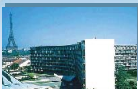
Siège de l'Unesco à Paris

Le lancement mondial de l'Année Internationale de la Planète Terre, qui aura lieu à Paris les 12 et 13 février 2008 à l'Unesco, est co-organisé par le Comité National Français (CNF-AIPT), le Bureau International de l'Année et l'Unesco. Il prévoit d'illustrer le potentiel des géosciences pour résoudre les problèmes de notre planète par des présentations et des débats entre décideurs, scientifiques, industriels, devant 350 invités et étudiants du monde entier, sélectionnés par concours.